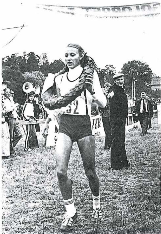
GRETE WAITZ, CK VIDAR NORGE